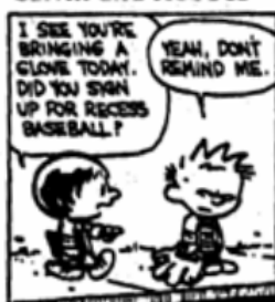
Calvin and Hobbes

As questões 12 e 13 referem-se ao cartoon abaixo: